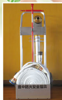
災害応急活動用資機材