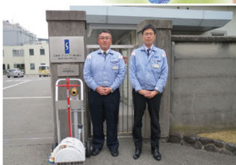
三栄源エフ・エフ・アイ(株)