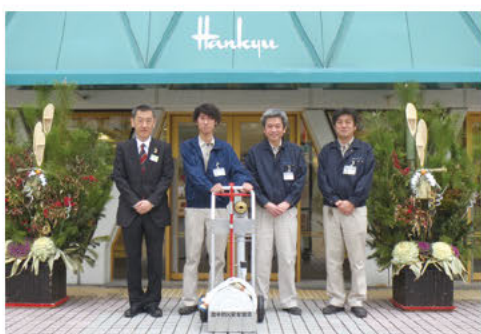
(株)阪急阪神百貨店 千里阪急

貸与される事業所は、(株)阪急阪神百貨店千里阪急、三栄源エフ・エフ・アイ(株)の2事業所に資機材が渡されました。