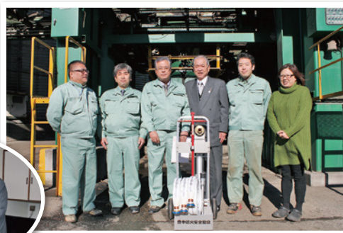
名神工業 株式会社