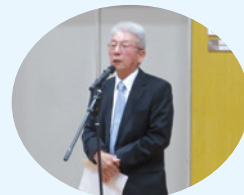
西口部会長のご挨拶

この研修会は、防火・防災思想の普及啓発を図るとともに、事業所の自衛消防隊が、災害発生時、初期消火や救急・救助活動を行うために必要な知識・技術を得得することを目的として、当協会と豊中市消防局が共同で実施しているものです。