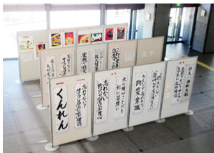
平成30年度防火作品の展示(市役所第二庁舎ロビー)

当協会は、毎年、豊中市消防局と協力して、消防に関する図画や習字を募集しています。