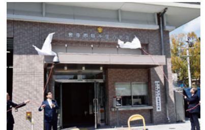
新千里消防署における除幕の様子

新千里消防署の設置に伴い、北消防署の管轄区域の一部が、新千里消防署の管轄区域となりました。管轄区域が変更となった区域は、次のとおりです。