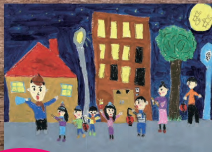
豊中市消防局長賞