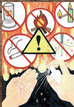
豊中防火安全協会長賞