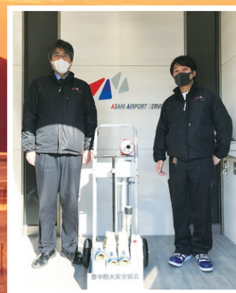
株式会社 朝日エアポートサービス