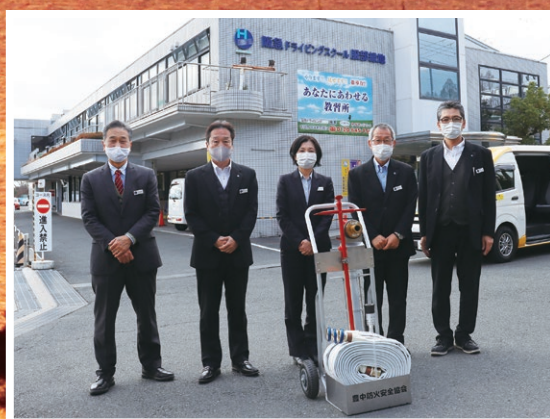
阪急ドライビングスクール服部緑地