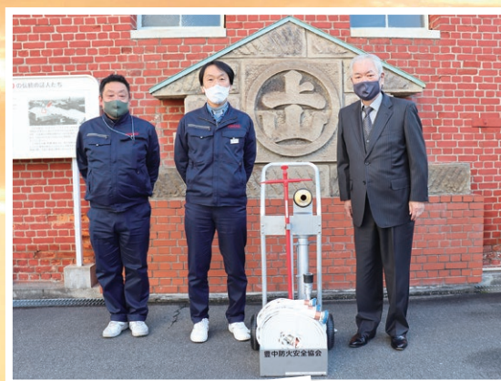
大日本除虫菊株式会社 大阪工場

貸与事業所には、事業所周辺の地域において大規模災害等による火災が発生した際に、貸与された資機材を活用して初期消火活動を行っていただきます。