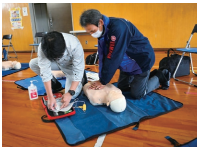
救命講習 A E D 取扱い訓練

今回の研修では、午前中に救命講習を行い、午後からは、防災訓練ハンドブック(本ページ下欄参照)を活用して、24事業所43名の参加者のみなさんが、救助救出や搬送法の訓練を行いました。