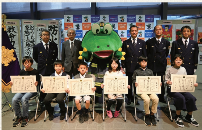
北・南・新千里消防署長賞 ご受賞のみなさん

令和3年11月5日(金)、市役所第二庁舎1階市民ロビーにて、防火作品優秀者の表彰式を行いました。 表彰式の対象者は、防火作品審査会で優秀賞に選考された70点のなかから、豊中防火安全協会会長賞(3点)・消防局長賞(3点)・北消防署長賞・南消防署長賞・新千里消防署長賞(各2点)に選ばれた12名のみなさんです。 当日は、12名の皆さん全員にご参加いただき、西口協会会長・小倉消防局長・各消防署長から、表彰状と副賞が授与されました。