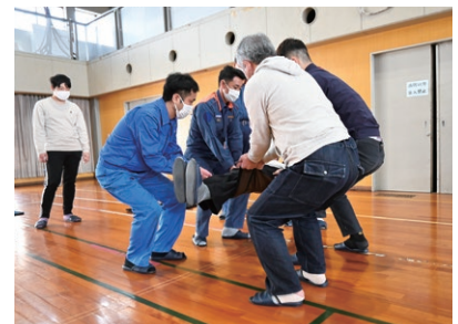
布担架による搬送訓練