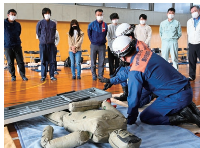
油圧ジャッキ取扱い訓練