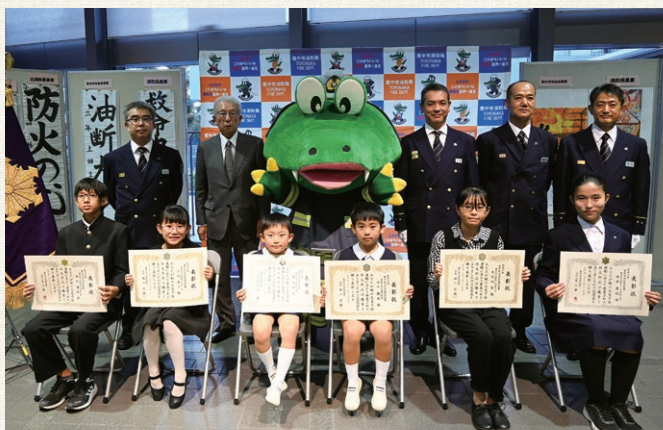
協会会長賞・消防局長賞 ご受賞のみなさん