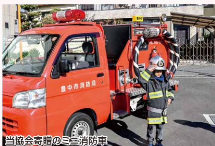
当協会寄贈のミニ消防車