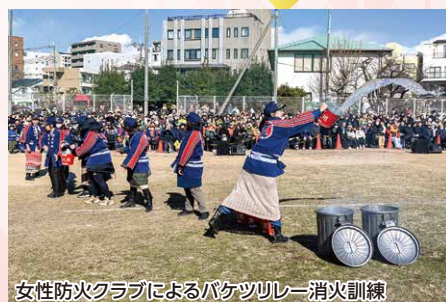
女性防火クラブによるバケツリレー消火訓練