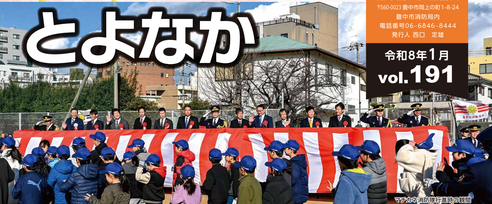
マチカネ消防隊行進時の観閲