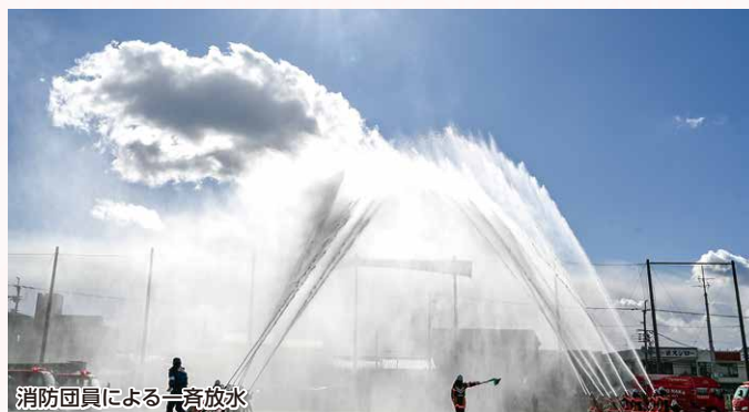
消防団員による一斉放水

新春の消防出初式が、1月11日(日)、大門公園にて挙行され、約3,500人の方がご来場されました。 午前10時から、消防音楽隊を先頭に、消防職員、消防団員をはじめ、女性防火クラブ、自主防災組織、消防防災協力事業所のほか、公募により小学校高学年の児童で結成した「マチカネ消防隊」も頼もしく行進しました。 式典においては、消防音楽隊による演奏、各種団体による火災、震災、化学物質漏洩など様々な災害想定が次々と展開する訓練が行われました。 締めくくりには消防団による出初の花形、大迫力の一斉放水が行われました。